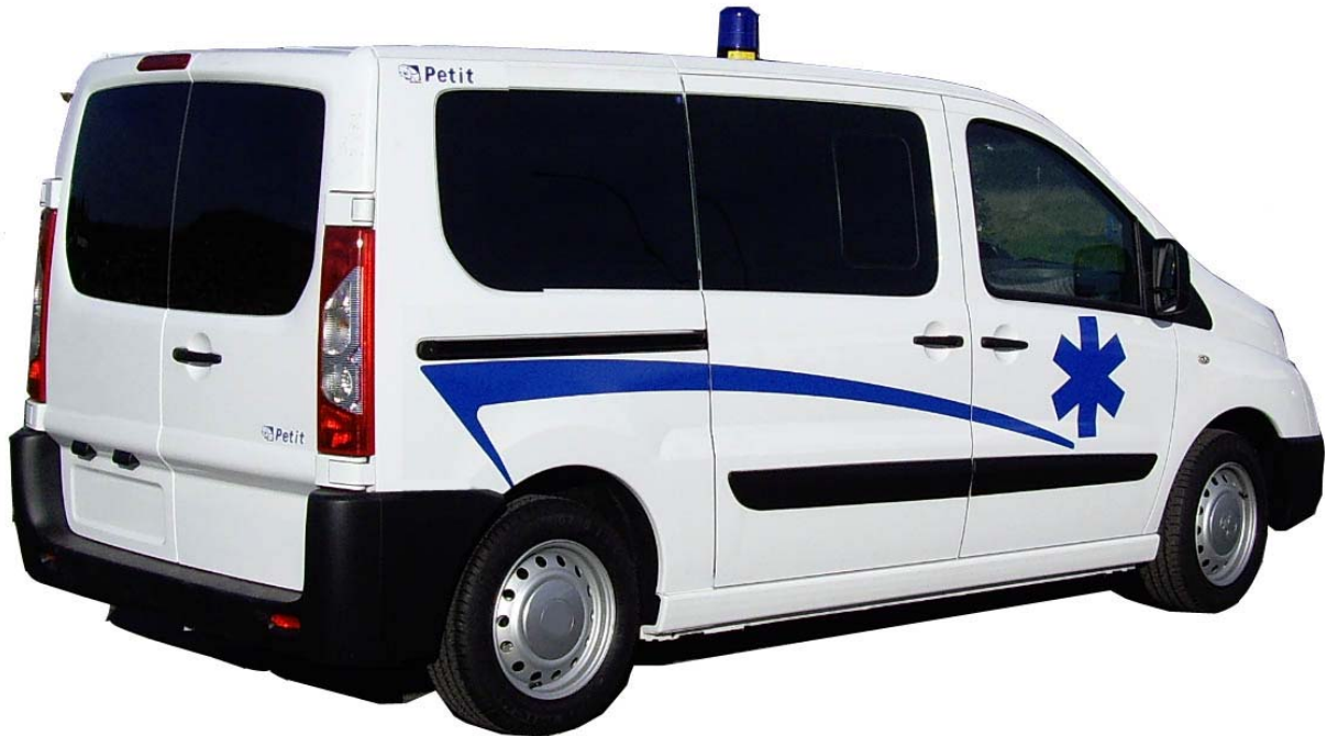
Véhicule présenté avec films noirs en option