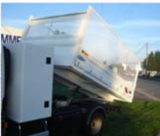
Coffre dos cabine (option) Rehausses latérales grillagées (option)