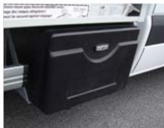
Coffre sous benne en polyéthylène (option)