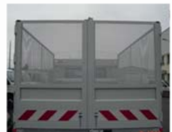
Porte 2 vantaux (option) Rehausses arrière grillagées (option)