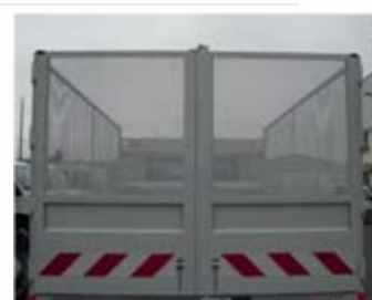
Porte 2 vantaux (option) Rehausses arrières grillagées (option)