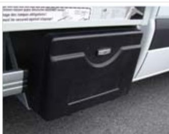
Coffre sous benne en polyéthylène (option)