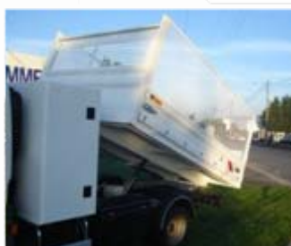
Coffre dos cabine (option) Rehausses latérales grillagées (option)