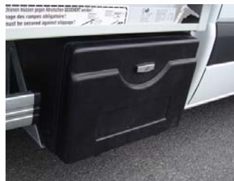
Coffre sous benne en polyéthylène (option)