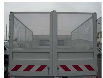
Porte 2 vantaux (option) Rehausses arrières grillagées (option)