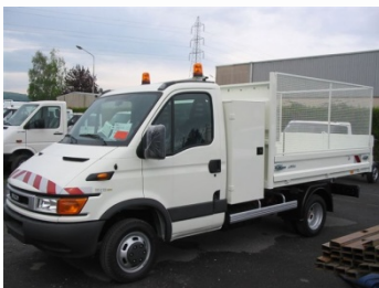
Coffre dos cabine (option) Rehausses latérales grillagées (option)