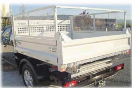
Rehausses grillagées (option)