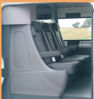
3 sièges individuels ergonomiques revêtement tissu GRUAU