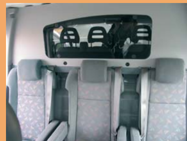
Cabine spacieuse et conviviale Sellerie non contractuelle