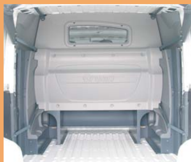
Cabine totalement isolée de la partie arrière.