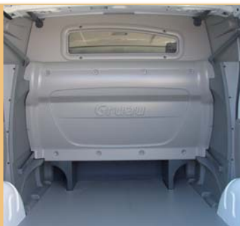
Cabine totalement isolée de la partie arrière.