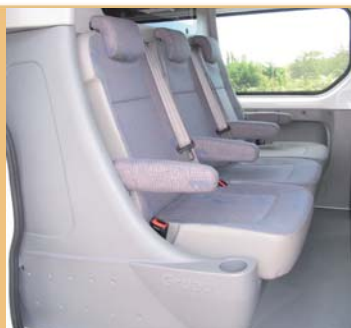
3 sièges individuels ergonomiques revêtement tissu (GENOLA)