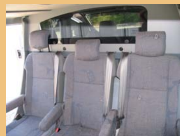
Cabine spacieuse et conviviale Sellerie non contractuelle