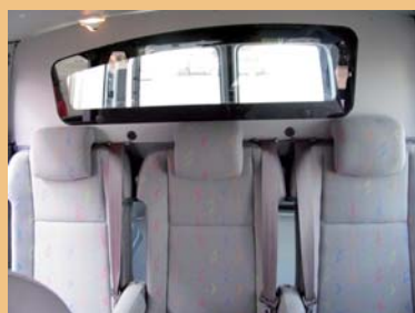
3 sièges individuels ergonomiques revêtement tissu d'origine