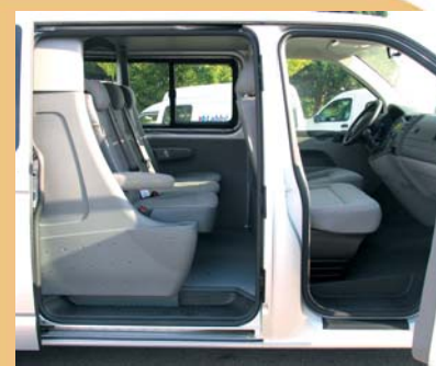
Assise avant et arrière au même niveau