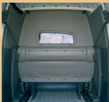
Cabine totalement isolée de la partie arrière.