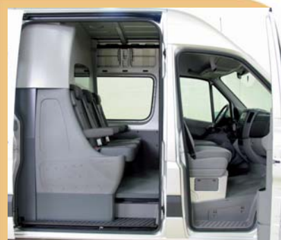
Assise avant et arrière au même niveau