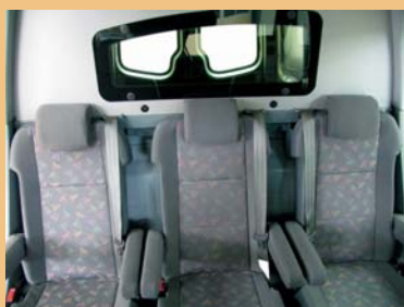
3 sièges individuels ergonomiques revêtement tissu GRUAU Cabine spacieuse et conviviale