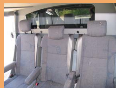
Cabine spacieuse et conviviale Sellerie non contractuelle