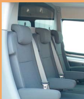
3 sièges individuels ergonomiques revêtement tissu d'origine