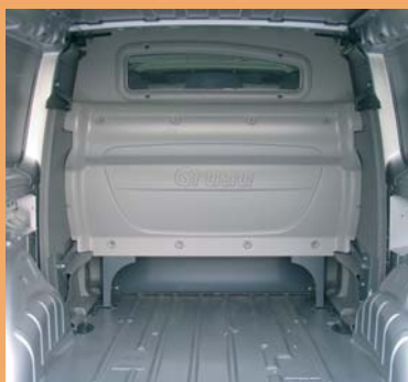
Cabine totalement isolée de la partie arrière.