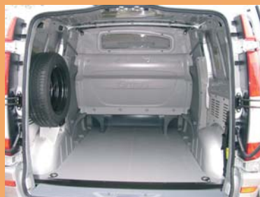
Cabine totalement isolée de la partie arrière.