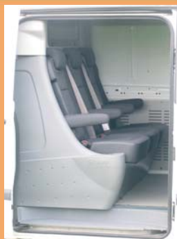
3 sièges individuels ergonomiques revêtement tissu Gruau (TORTELLA)