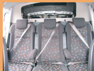
Cabine spacieuse et conviviale Sellerie non contractuelle