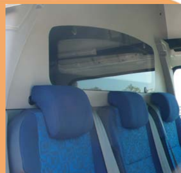
Appui-têtes réglables type "virgule"