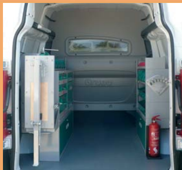
Système métallique de rangement en option