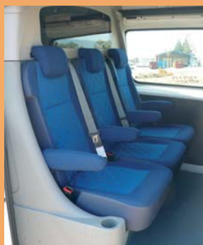
3 sièges individuels ganis tissu d'origine