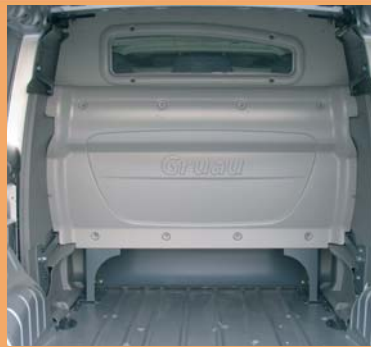
Cabine totalement isolée de la partie arrière.