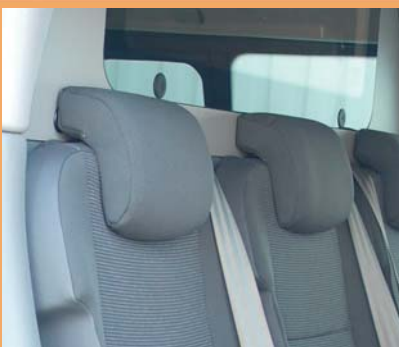
3 sièges individuels ergonomiques revêtement tissu