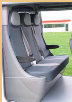
Banquette préformée 3 places pratique et facile d'entretien.