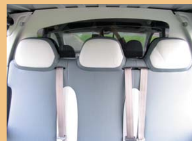
Appui-têtes intégrés et vitre cloison cabine pour une visibilité arrière