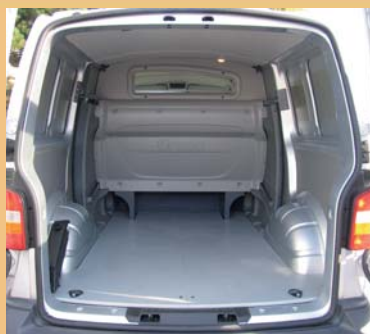
Cabine totalement isolée de la partie arrière.