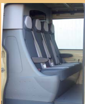
Banquette préformée 4 places pratique et facile d'entretien.