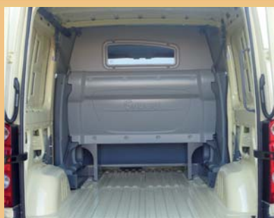
Cabine totalement isolée de la partie arrière.