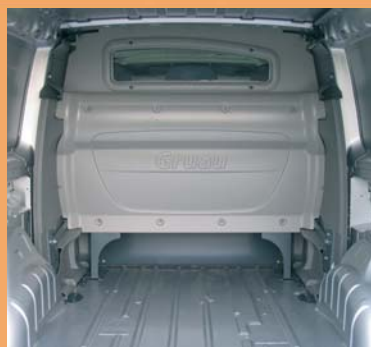
Cabine totalement isolée de la partie arrière.