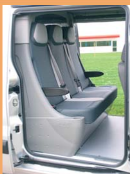
Banquette préformée 3 places pratique et facile d'entretien.