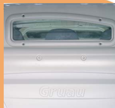
Visibilité arrière par la vitre cloison cabine.