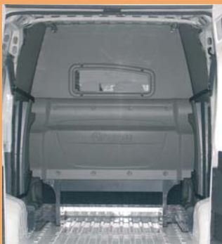
Cabine totalement isolée de la partie arrière.