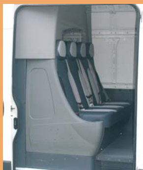
Banquette préformée 4 places pratique et facile d'entretien.