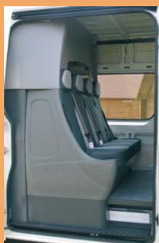
Banquette préformée 4 places pratique et facile d'entretien.