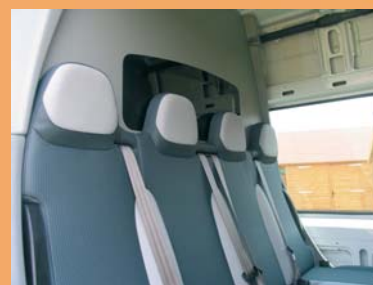
Appui-têtes intégrés et vitre cloison cabine pour une visibilité arrière