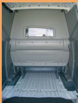
Cabine totalement isolée de la partie arrière.