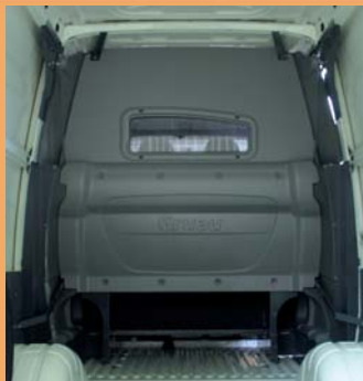
Cabine totalement isolée de la partie arrière.