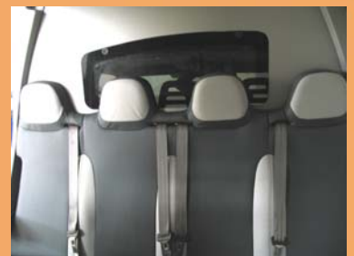
Appui-têtes intégrés et vitre cloison cabine pour une visibilité arrière