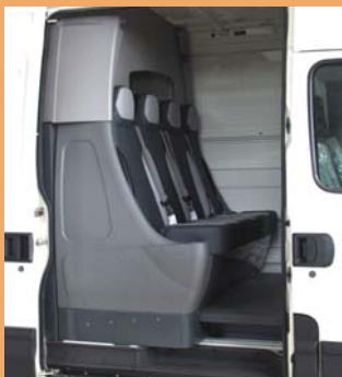
Banquette préformée 4 places pratique et facile d'entretien.