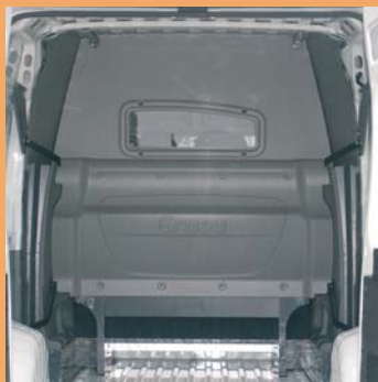
Cabine totalement isolée de la partie arrière.