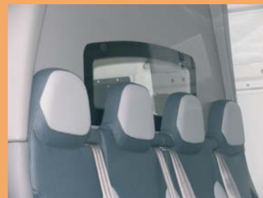
Appui-têtes intégrés. Visibilité arrière par la vitre cloison cabine.