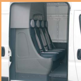
Banquette préformée 4 places pratique et facile d'entretien.