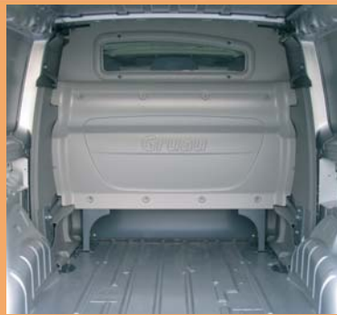
Cabine totalement isolée de la partie arrière.