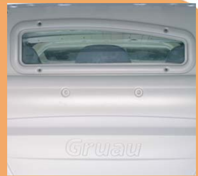
Visibilité arrière par la vitre cloison cabine.