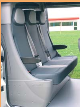
Banquette préformée 3 places pratique et facile d'entretien.