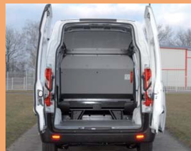
Cloison pour protéger les passagers et accès sous banquette pour les objets longs.