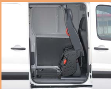
Version repliée pour le transport de marchandises.