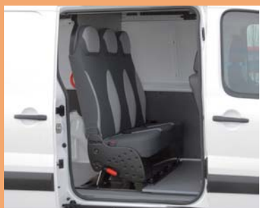
Version dépliée pour le transport de personnel.