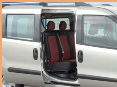
Version dépliée pour le transport de personnel.