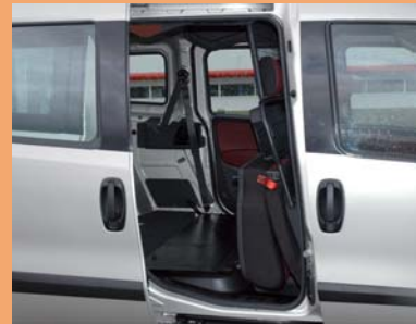
Version repliée pour le transport de marchandises.