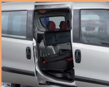
Étape intermédiaire : Dossier rabattable..