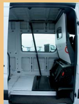
Version repliée pour le transport de marchandises