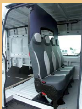
Version dépliée pour le transport occasionnel de personnel