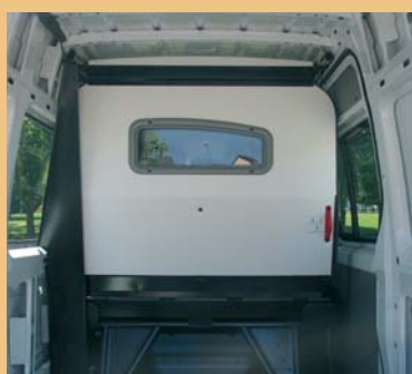
Cloison pour protéger les passagers et accès sous banquette pour les objets longs.