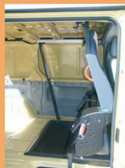
Version repliée pour le transport de marchandises