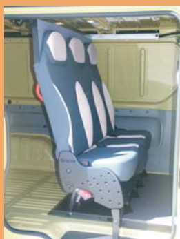
Version dépliée pour le transport occasionnel de personnel