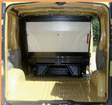
Cloison pour protéger les passagers et accès sous banquette pour les objets longs.