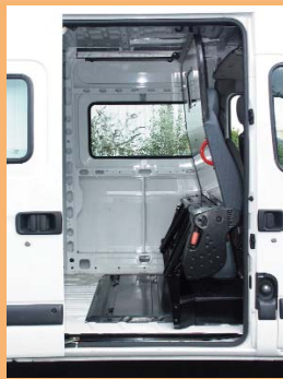
Version repliée pour le transport de marchandises