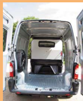
Cloison pour protéger les passagers et accès sous banquette pour les objets longs