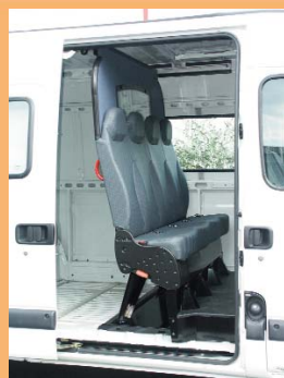
Version dépliée pour le transport occasionnel de personnel