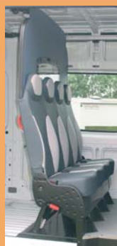
Version dépliée pour le transport occasionnel de personnel