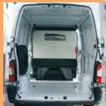
Cloison pour protéger les passagers et accès sous banquette pour les objets longs