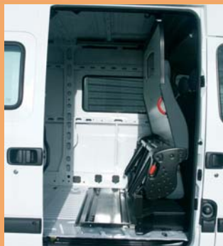
Version repliée pour le transport de marchandises