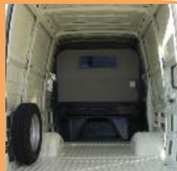
Cloison pour protéger les passagers et accès sous banquette pour les objets longs