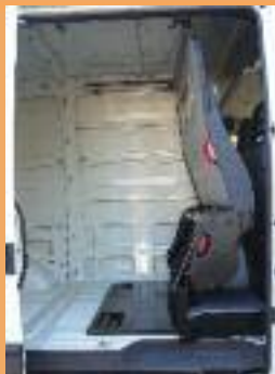
Version repliée pour le transport de marchandises