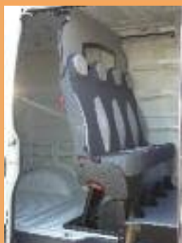
Version dépliée pour le transport occasionnel de personnel