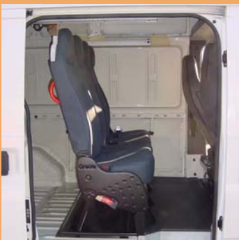
Version dépliée pour le transport occasionnel de personnel