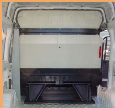
Cloison pour protéger les passagers et accès sous banquette pour les objets longs.