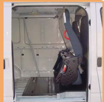
Version repliée pour le transport de marchandises