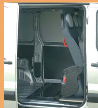
Version repliée pour le transport de marchandises