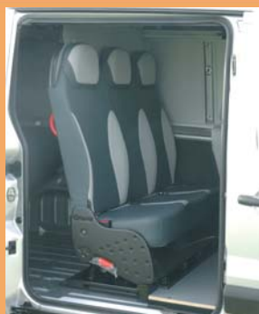
Version dépliée pour le transport occasionnel de personnel