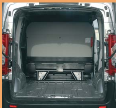
Cloison pour protéger les passagers et accès sous banquette pour les objets longs.