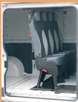
Version dépliée pour le transport occasionnel de personnel