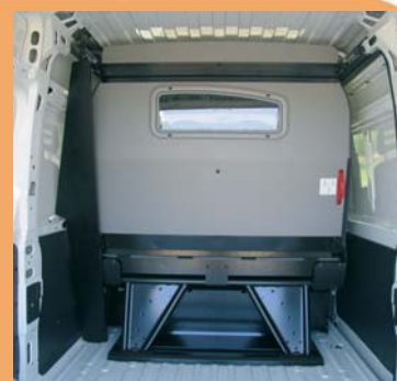
Cloison pour protéger les passagers et accès sous banquette pour les objets longs