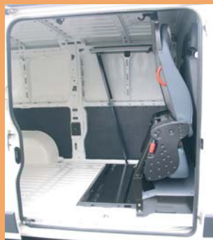
Version repliée pour le transport de marchandises