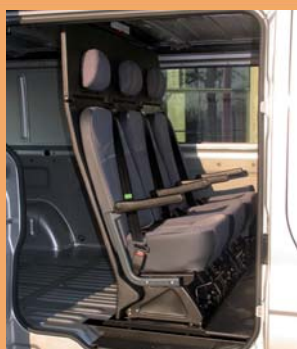
3 places arrière