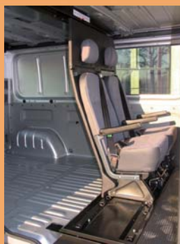
2 places arrière à gauche ou à droite