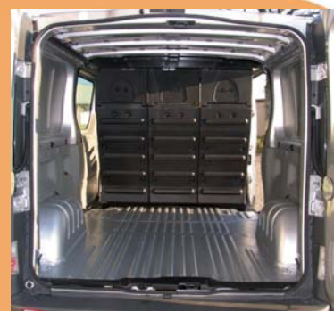
Coque rigide à l'arrière des sièges assurant la protection des passagers