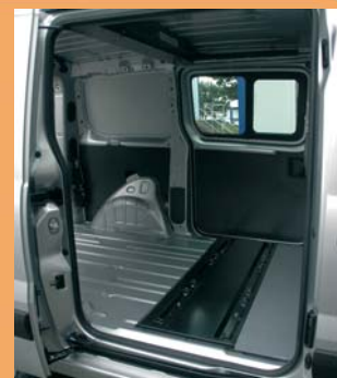
Transport de marchandises