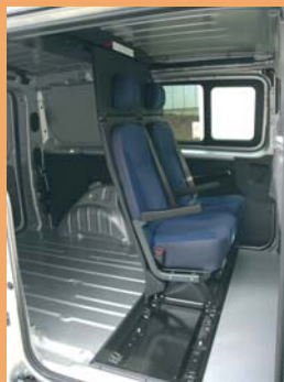
2 places arrière à gauche ou à droite