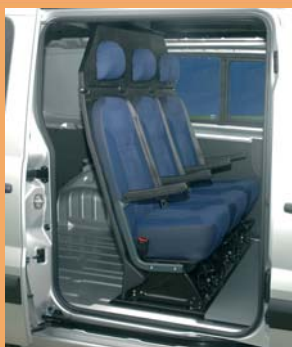
3 places arrière