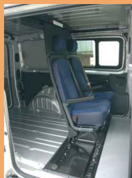
2 places arrière à gauche ou à droite