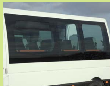
Baies panoramiques teintées offrant esthétisme et visibilité.