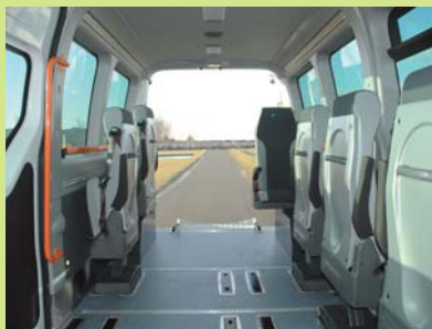
Modularité extrême. De 1 à 5 fauteuils roulants et de 1 à 6 sièges Multifonctions.