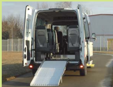
Version Sthandy : rampe manuelle relevable en 3 parties.