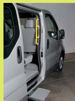
Poignée montoir et marchepied en option