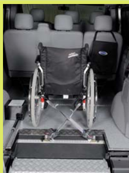
Système de relevage automatique de la rampe d'accès