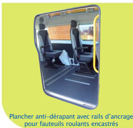
Plancher anti-dérapant avec rails d'ancrage pour fauteuils roulants encastrés

Véhicule présenté avec l'option vitrage latéral dans la partie réhaussée.