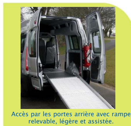
Accès par les portes arrière avec rampe relevable, légère et assistée.