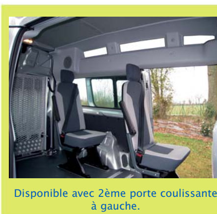
Disponible avec 2ème porte coulissante à gauche.