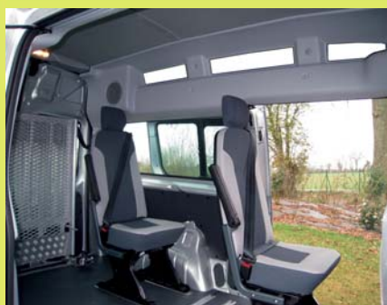
Disponible avec 2ème porte coulissante à gauche.