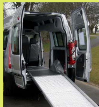
Accès par les portes arrière avec rampe relevable, légère et assistée.