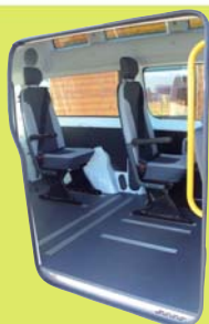
Plancher anti-dérapant avec rails d'ancrage pour fauteuils roulants encastrés

Véhicule présenté avec l'option vitrage latéral dans la partie réhaussée.