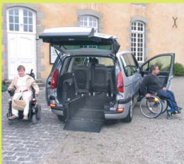
Décaissement arrière spacieux.

MONOSPACE 807 GRUAU, version «HACCESS PLUS» 6 PLACES DONT 1 EN FAUTEUIL ROULANT – Siège Turny en option