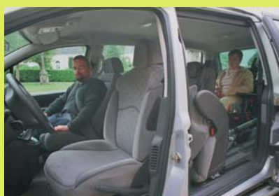
Habitacle cosy, fonctionnel et convivial.