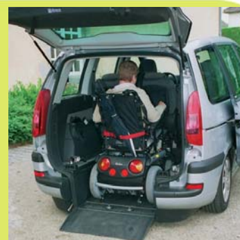
Accès exceptionnel, facilité par l'abaissement automatique de la suspension et une rampe relevable, très courte.