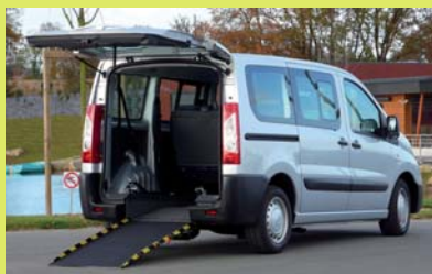
Version Sthandy : rampe légère anti-dérapante, relevable manuellement en 2 parties