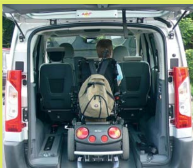
Véhicule spacieux faites de la route un espace de vie