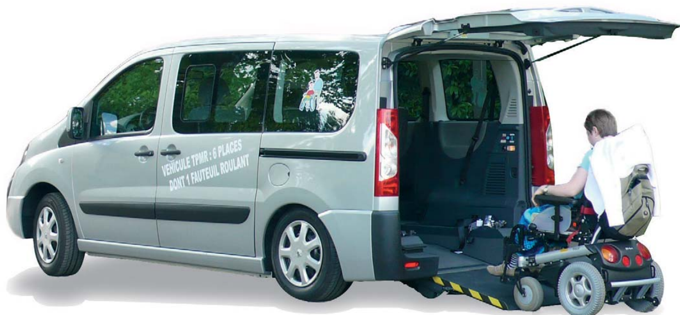
Version HACCESS PLUS : rampe manuelle courte et abaissement automatique du véhicule