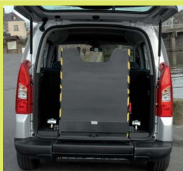
Rampe légère antidérapante, assistée, relevable manuellement en 1 partie.