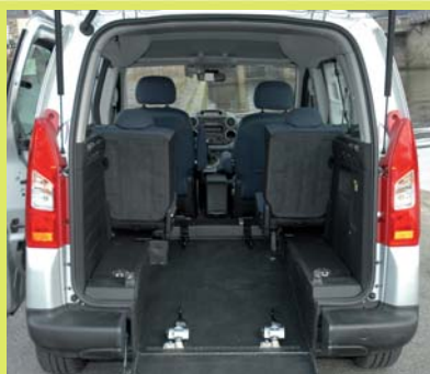
Large décaissement de la partie arrière recouvert d'antidérapant et insonorisé.