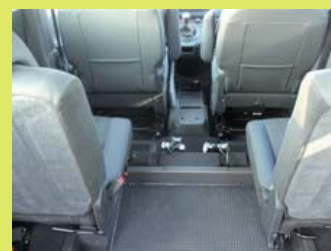
Option : 2 enrouleurs électriques à l'avant du décaissement.