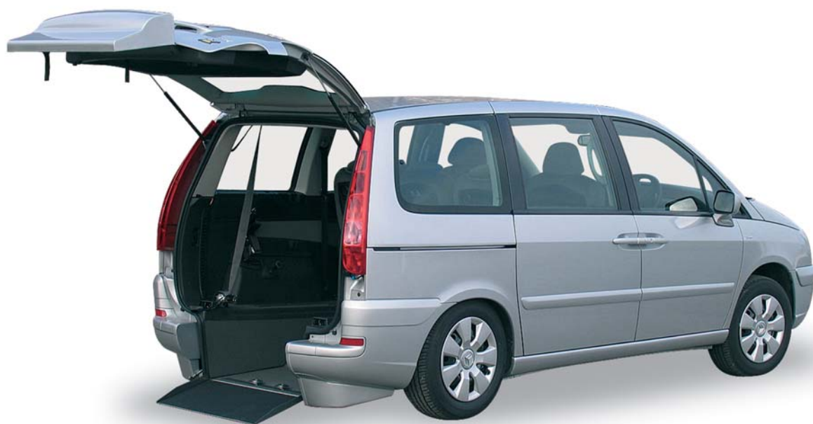
MONOSPACE C8 GRUAU, version «Haccess Plus» 6 PLACES DONT 1 EN FAUTEUIL ROULANT