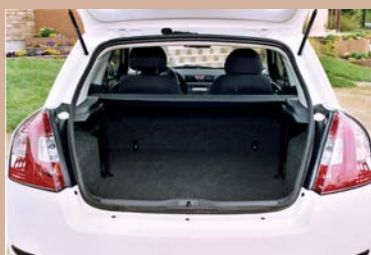
Plancher garni moquette. Option Tablette cache-bagage