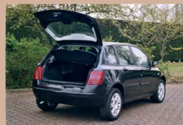
Transformation sur véhicule 3 ou 5 portes