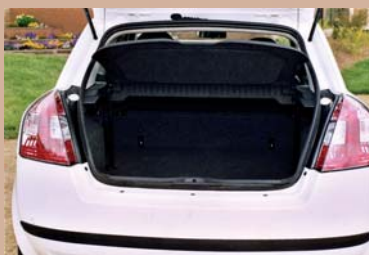
Option Tablette cache-bagage se positionnant derrière la tablette d'origine