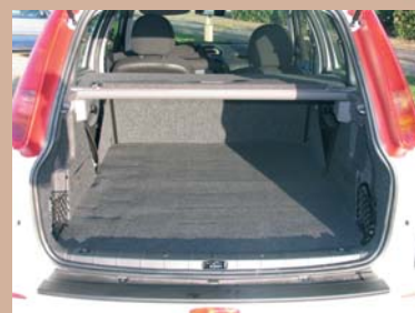
Option Tablette cache-bagage repliable type accordéon