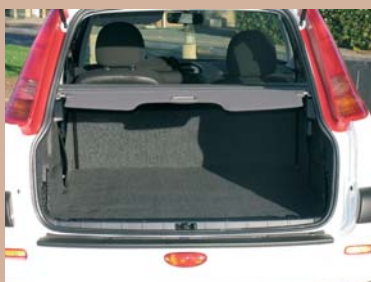
Plancher garni moquette Option tablette cache-bagage