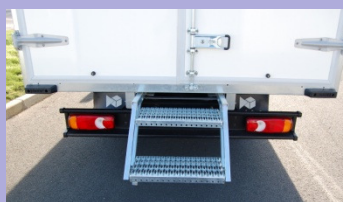
Escabeau coulissant 2 marches