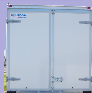
Tringlerie et poignée en appliques Feux de gabarit haut de caisse

LABBÉ, N°1 FRANÇAIS DU FOURGON GRAND VOLUME