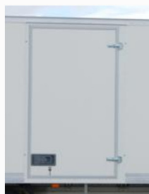
Porte latérale battante