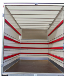
Aménagement Meubles 4 Capitons 3 Tubes d'arrimage