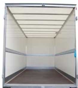
Aménagement Messagerie 1 rail d'arrimage