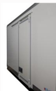
Porte latérale coulissante