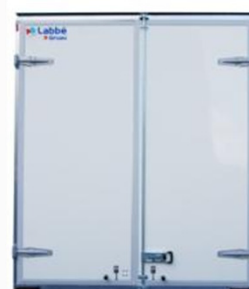
Fermeture arrière par 2 portes battantes Poignée en applique