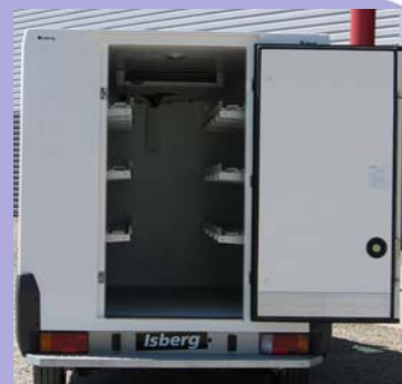
Une porte arrière centrale 870X1700.