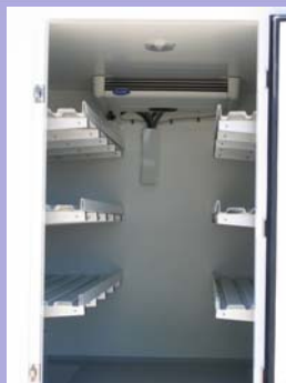
Etagères inclinées réglables en option