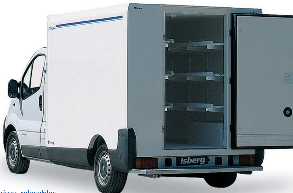
Option étagères relevables