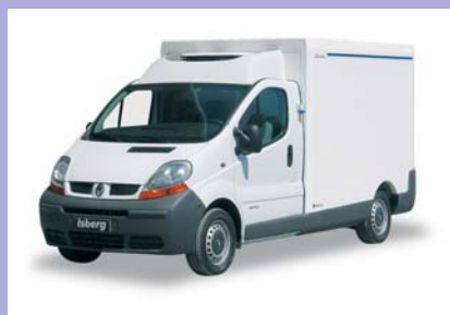
Déflecteur aéro sur cabine