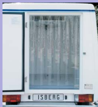
Option rideau anti-déperdition