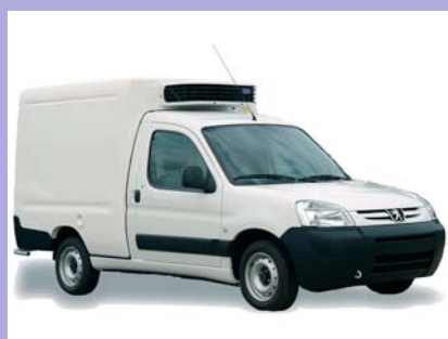
Groupe frigorifique en option