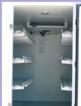
Etagères inclinées réglables en option