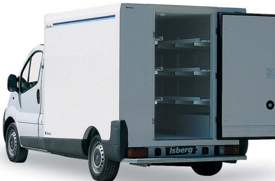
Option étagères relevables