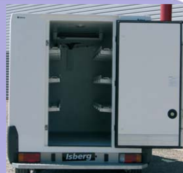
Une porte arrière centrale 870X1700.