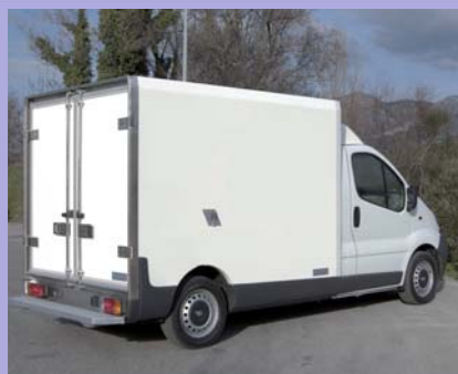
Ouverture total arrière en option